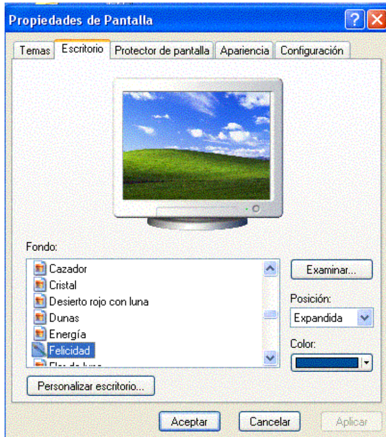
Figura No. 2.10. Propiedades de pantalla. Ficha Escritorio

Ficha Escritorio , se activa con un clic en la ficha. Ver figura No. 2.10