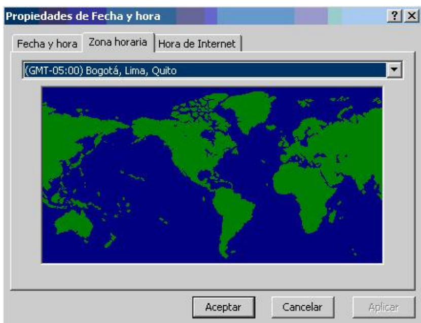
Figura No. 2.13 Zona horaria

Para seleccionar la ubicación da un clic en el botón , para que muestre la lista de algunas zonas mundiales.