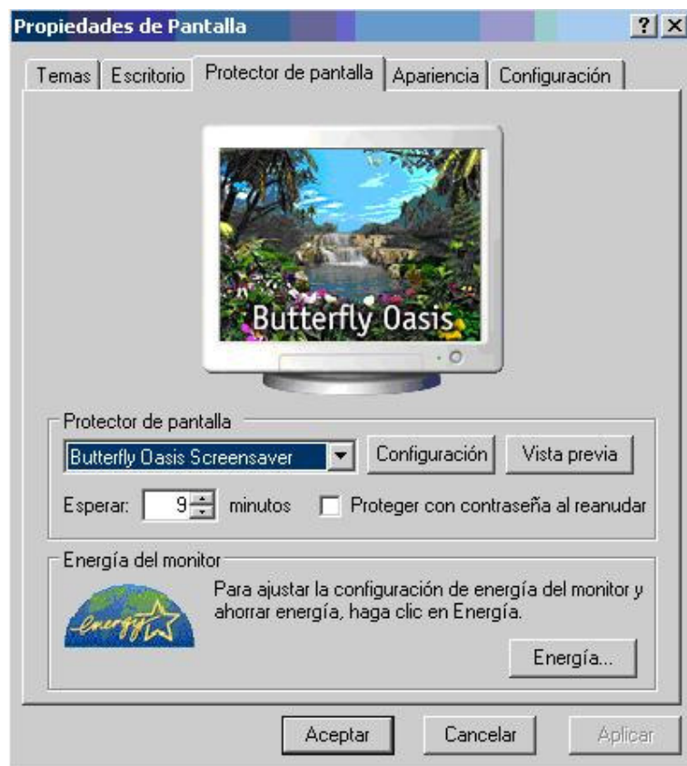
Figura No. 2.9 propiedades de pantalla. Protector de pantalla

Ficha protector de pantalla , Se activa con un clic en la ficha. Y la presentación de la ventana se encuentra en la siguiente figura No. 2.9