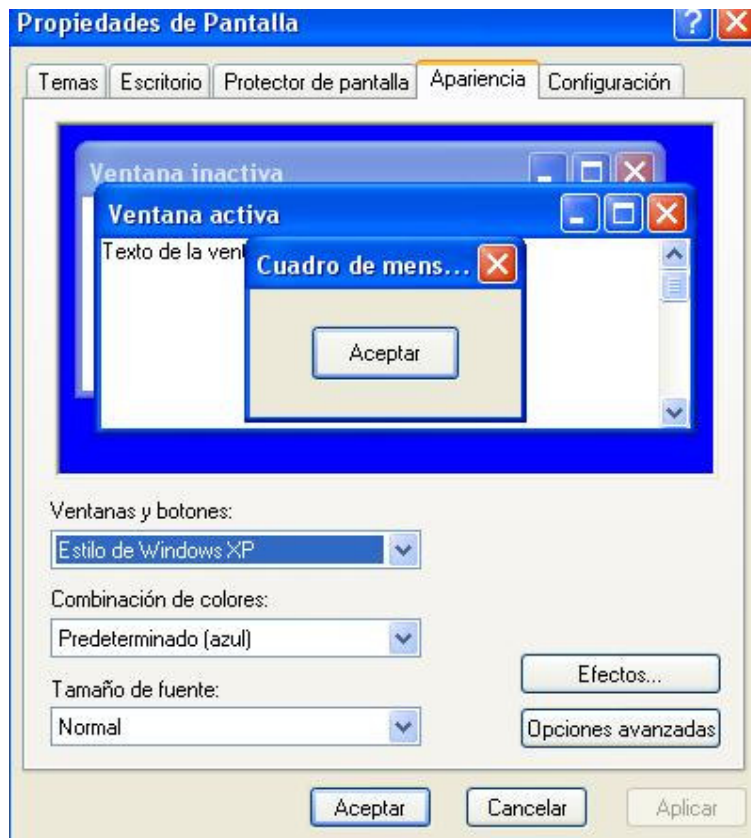
Figura No. 2.11 Propiedades de pantalla. Ficha Apariencia

A las ventanas se les puede cambiar la apariencia en tamaño, colores y tipo de letra. Para cambiarle los diferentes tipos y formas de apariencia a las ventanas realice los siguientes pasos: