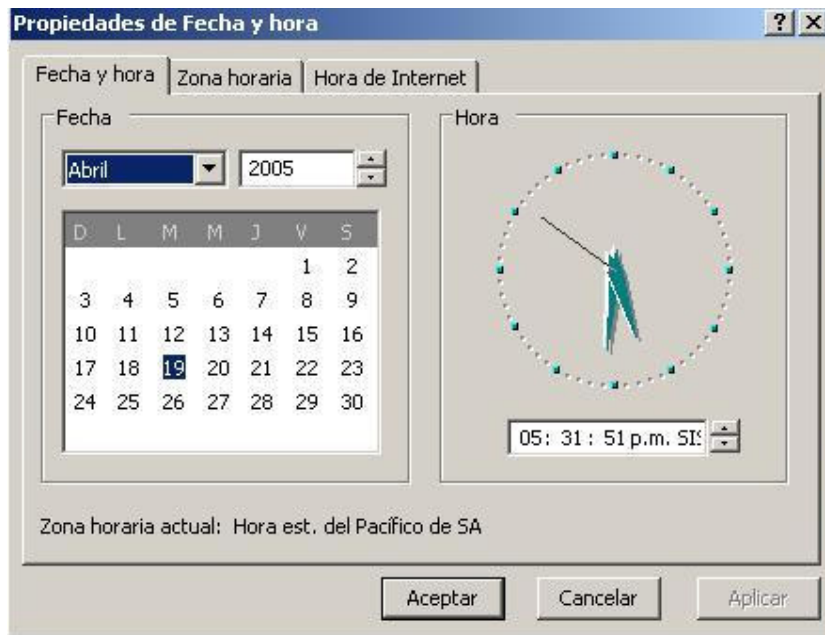
Figura No. 2.13 Propiedades de fecha y hora

Existen tres fichas: fecha y Hora , Zona Horaria , Hora de Internet